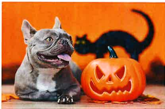
↑ このくらい頼めるけど、気持ちだけは優しい。

私の周りの人達も推し活に燃えてる人達が居て、『羨ましいなあ』とっていました。そんな中、風さんの楽曲に最初に出会ったのは、『キラリ』です。すごいカッコいい曲だ！とっていました。他のアーティストと同じように、アルバムを借りてきて車に落として聞くくらい。結婚する前から、うちの夫がTSUTAYAで、CDをレンタルしてせっせとダビングしています。なんてアナログなっ！車に内臓のハードディスクに録音しているので、車とお別れするときには十何年分の撮り貯めた楽曲もお別れです。カラオケも好きでたまに行くのですが、そこで本人映像のミュージックビデオを見たときに、更に衝撃を受けました。クオリティがヤバイ！！これはもっと見てみたいと、思いましたが中々時間が取れずにいました。