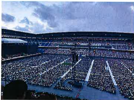
7万人！2日合わせて14万人！

「そりゃあもう行くでしょ」となり、子供たちに一緒に行くか聞いてみたところ、長男と次男は行きたい言いました。風さんは超人気なのでチケットが取れないと聞いていました。一度に申し込めるのは2名。息子二人はライブは初めてなので、二人はセットで、私は単品で申し込みをしました。抽選結果は私だけがハズレました…。私が言い出し、お金も払うのになんかおかしいなと思っていると、次男が譲ってくれました。転売防止のために、入場に身分証明書の提示が必要で、色々厳しくなっています。名前が男だし、年齢も全然違うし、大丈夫かな～と思いながら開催を待ちました。