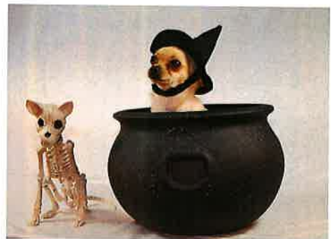
↑ このホネホネわんにかっこいい！！

4月からの入院は個室だったので、パソコンで仕事しながら、風さんのユーチューブを見まくりました。子供のころの弾いてみた動画や即興でリクエストに応じて弾き語りをする「寝そべり配信」というものがあり、風さんの人柄に、決定的に沼にハマってしまいました。新時代の子だからか、ファンクラブはないので、退院と同時にアプリに登録し、ストリーミングで聞いているけれども、CDを買いました。